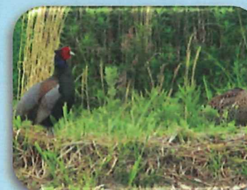
徳風園の近くを散歩するキジの様子