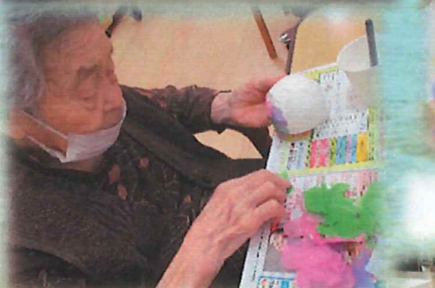
オリジナル風鈴作り