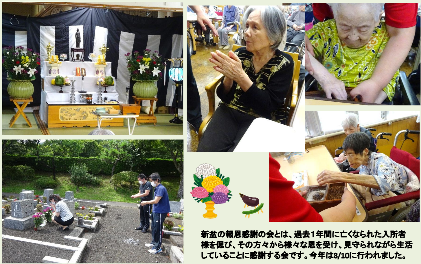
新盆の報恩感謝の会とは、過去1年間に亡くなられた入居者様を偲び、その方々から様々な恩を受け、見守られながら生活していることに感謝する会です。今年は8/10に行われました。