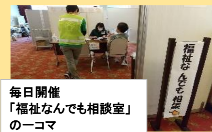
毎日開催「福祉なんでも相談室」の一コマ